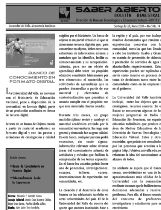
Imagen Anterior »