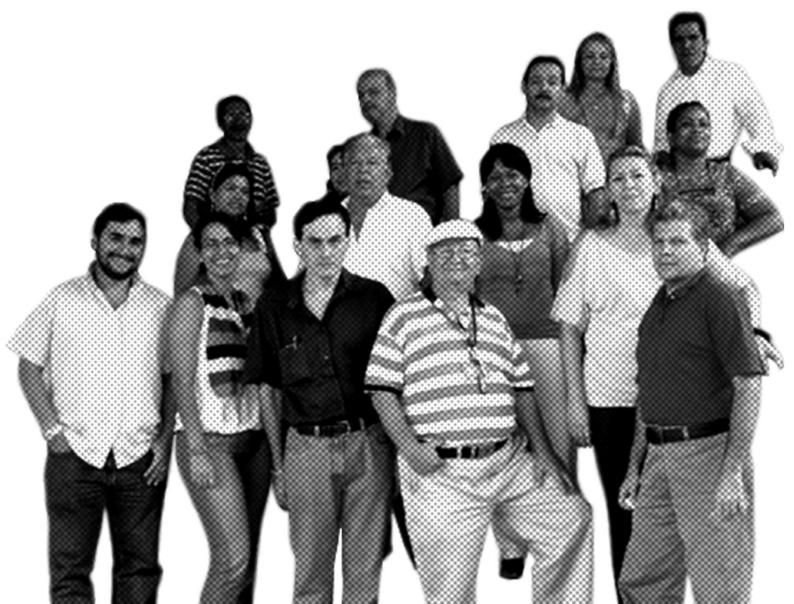
Profesores y profesoras del curso MAF

«He visto el cambio en mi práctica docente desde que inicié el curso con esos nuevos recursos, los he aplicado, los estudiantes están muy contentos con los cambios. Falta un poco de interacción con ellos, pero ese espacio nuevo ha creado más continuidad en los cursos que doy. Hay muchas cosas por aprender. Hemos aprendido cosas, pero yo creo que hay que seguir ampliando esto. La autoformación debe ser constante y la idea es crear una red virtual y no parar».