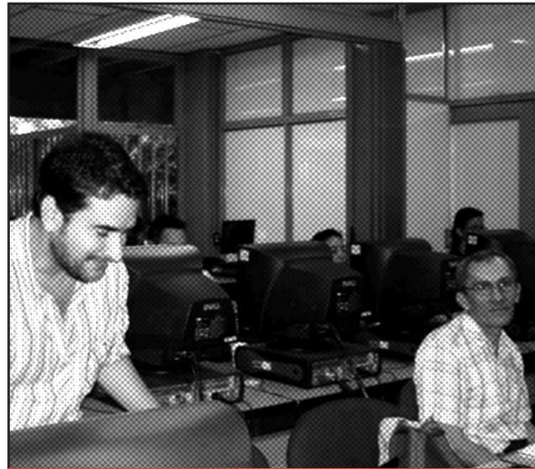
Los profesores podrán integrar nuevas herramientas pedagógicas y tecnológicas en su práctica docente

Un conjunto de documentos (escritos, audiovisuales, impresos y electrónicos).