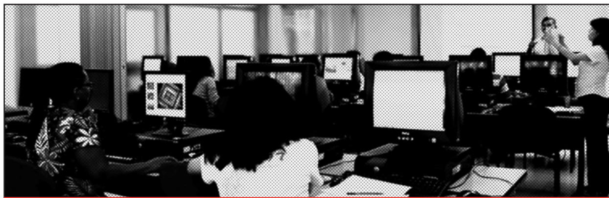
El curso MAF fué dirigido a profesores de educación básica y media

Durante el primer semestre de 2010, la Dirección de Nuevas Tecnologías y Educación Virtual ha llevado a cabo el Curso de Metodologías de Autoformación, MAF, con uso intensivo de tecnologías de información y comunicación, dirigido a profesores de educación básica y media, en el marco del convenio “Fortalecimiento de las competencias docentes y estudiantiles” firmado entre la Universidad del Valle y la Secretaría de Educación Municipal, que lidera la Dirección de Extensión.