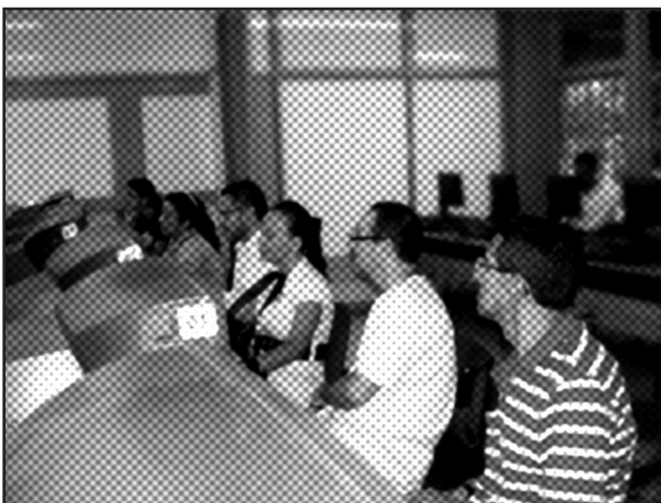
Los profesores desarrollaron proyectos de intervención en su comunidad educativa

Encuentros finales para compartir la experiencia vivida y los productos logrados.